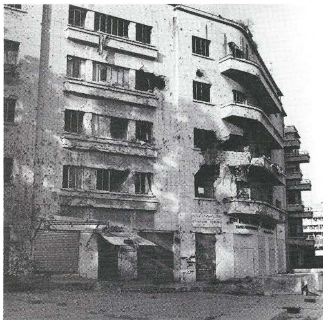
Beiroet; verbinding tussen Oost en West. Gebouwen lijken verlaten, maar blijken allemaal bewaakt

De 'tauromaquia', de edele kunst van het stierenvechten vormt momenteel Blanca's grootste passie. Hij reist daarvoor langs de Spaanse en Zuid-Franse arena's. 'Aanvankelijk wilde ik een mobie-