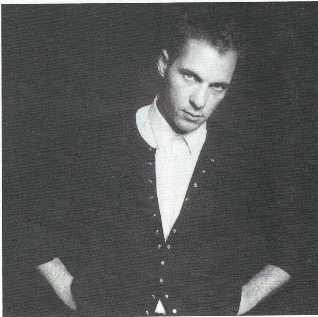
Paul Blanca

Na Barcelona en Parijs exposeert de Amsterdamse fotograaf Paul Blanca (1954) in het hoofdstedelijke Museum Fodor zijn foto's van Huilende Vrouwen . Behalve dit vrije werk maakt Blanca foto's voor onder meer Het Parool , Franse en Spaanse bladen. Eerder fotografeerde hij documentair getinte studio-portretten van heroïne-prostituées. Een ongepubliceerde serie foto's van stieregevechten reserveert Blanca voor een later uit te voeren 'installatie'.