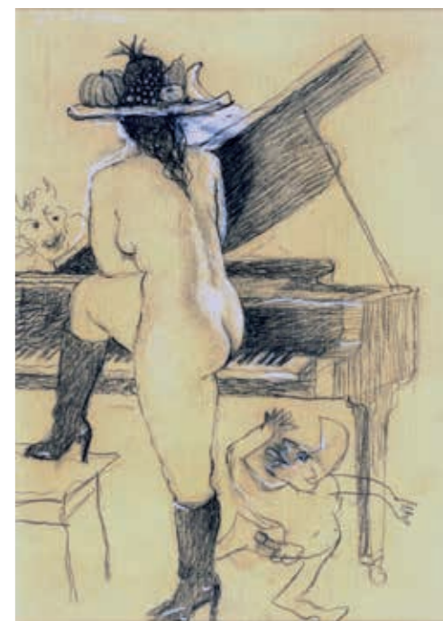
5 Naakt bij de vleugel, houtskool en wit krijt op papier, 65 x 50 cm, ca. 2003