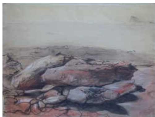
2 De kust van Ibiza, zwart, rood en wit krijt en gouache op papier, 50 x 65 cm, mei 1960, collectie Museum Het Rembrandthuis. Van deze voorstelling maakte Veldhoen ook een ets (Vroom 60-11, p. 41).