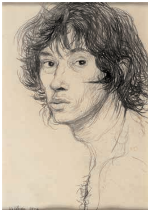
1 Zelfportret, houtskool op papier, 30 x 42 cm, 1954

Vorige pagina: Zelfportret met gasmasker, pastelpotlood op papier, 60 x 50 cm, 1977