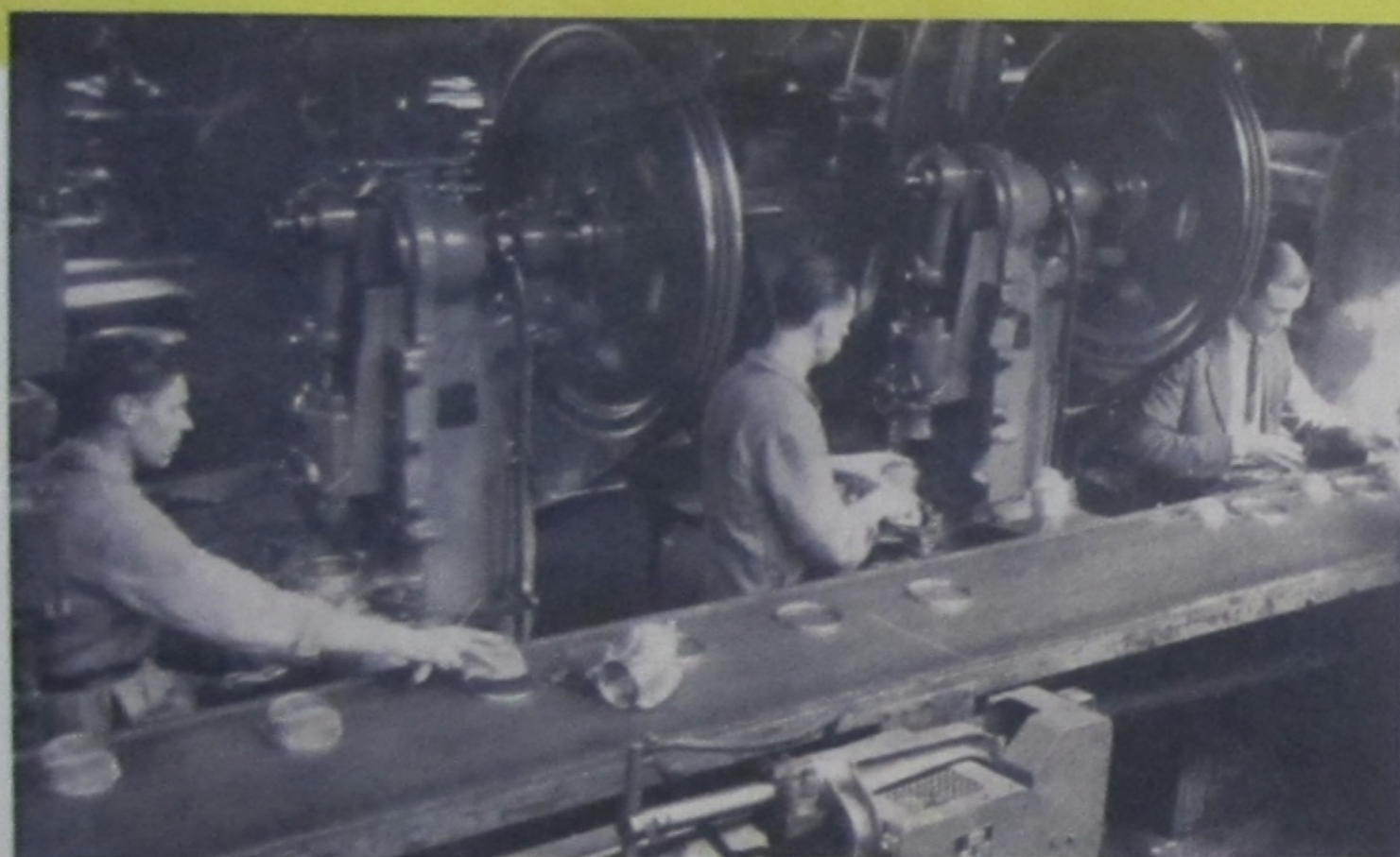
Productie van zeven aan de lopende band in de fabriek in Zwijndrecht, 1948.