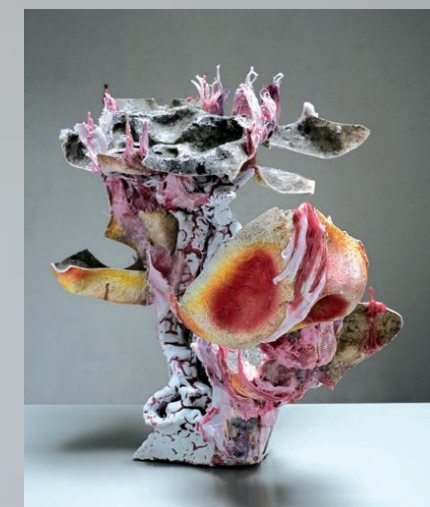
< Zonder titel, 2006, keramiek hars, hout, staal, 118 x 100 x 165 cm