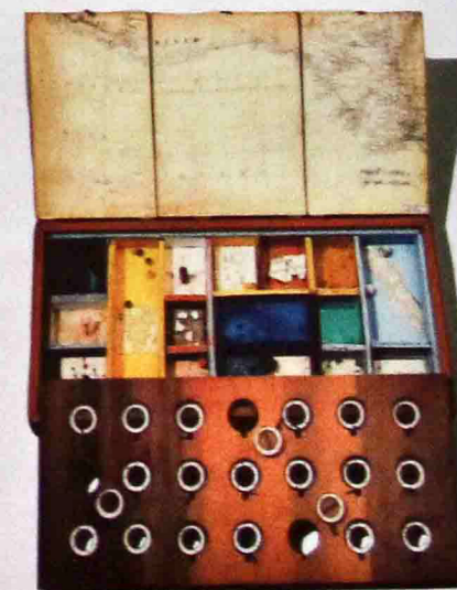
Object (Roses des Vents), 1942-1953, coll. MoMA, NY