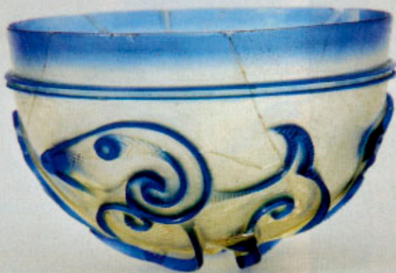
Kom (Egypte of Iran, 10de eeuw) van glas, na het blazen als een camee geslepen.