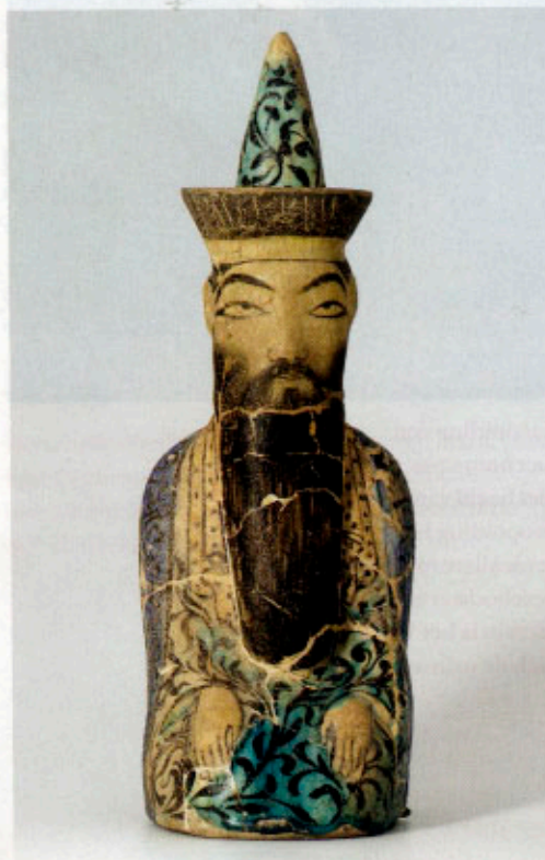
Schaakstuk in de vorm van een zittende man, Iran, 13de eeuw. Op

Je gelooft hem dan ook direct als hij vertelt dat tranen in zijn ogen schoten toen hij deze selectie uit zijn collectie in een — ofschoon niet meer als dusdanig gebruikte — kerk zag prijken. Maar zelf slik je ook even wanneer je in het koor een prachtig uitgelicht Koranvers van bijna zes strekkende